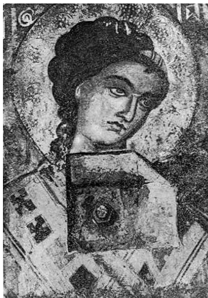
Fig. 4. - Gabrieli, punë e David Selenicasit në Shënkoll të Voskopojes.