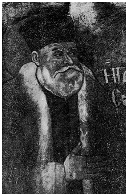
Fig. 2. - Portreti i kriterit të Kishës së Shënkollit në Voskopojës, punë e David Selenicasit.