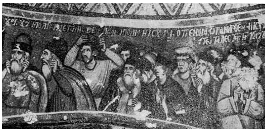
Fig. 7. - Tregëtarët, detal nga scena «djegja e Babilonës», punë e Kostandin e Athanas Zografit në Shënthanas të Voskopojës.