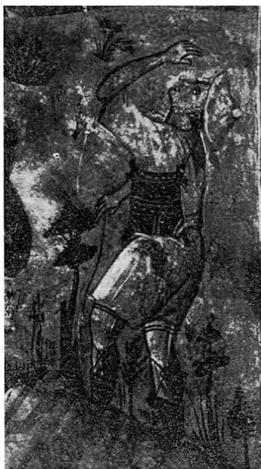
Fig. 9. - Bariu, detal, punë e David Selenicasit, ne Shënkoll të Voskopojes.