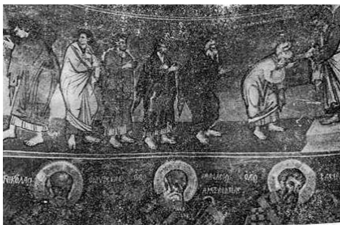
Fig. 6. - Kungimi i apostujve, detal, punë e David Selenicasit, Shënkoll të Voskopojës.