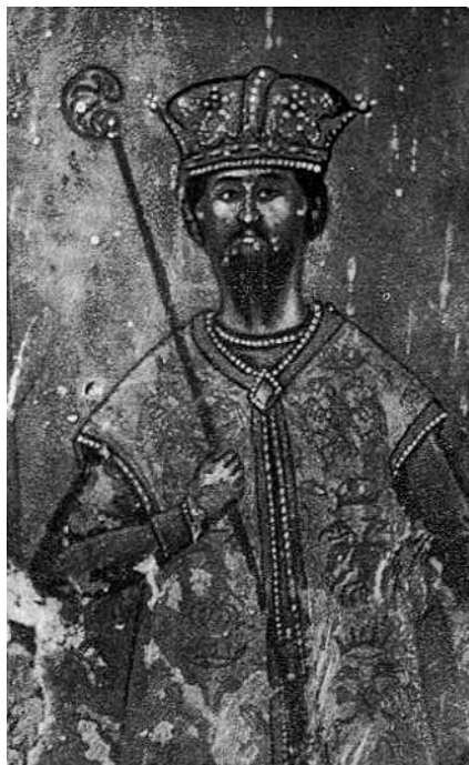
Fig. 8. - Karl Topia, detal ikone, punë e Kostandin Shpatarakut në Manastir të Ardenicës.